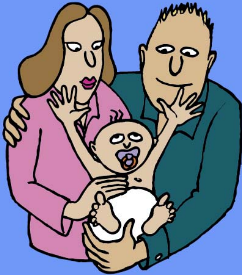
Vielleicht bei Familie Müller?

So etwas kann in vielen Familien passieren: